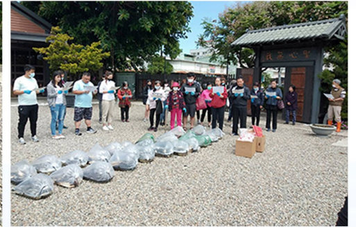
四月份小放生之景