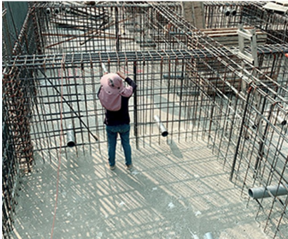
各水箱間相通管預留 預留管周邊鋼筋補強