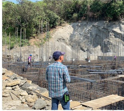
水保技師蒞臨督導