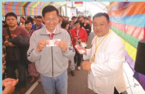
信眾換得「錢母」喜孜孜