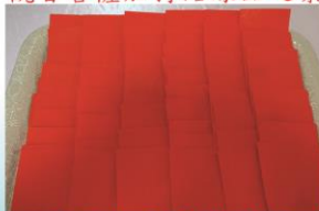
天官法會福袋結緣