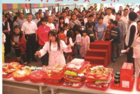
觀音菩薩加持結緣品之景