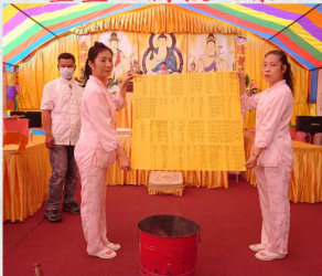
恭焚功德主名單之景