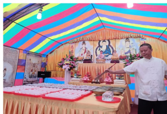
藥師佛臨駕加持水供養