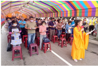
誦唸放生儀軌之景