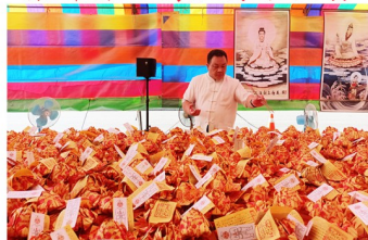
地藏王菩薩暨觀世音菩薩臨駕教化紙人過運之景