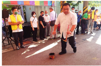
關聖帝君臨駕開教七星火過運