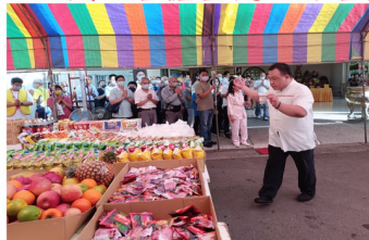
暨加持結緣品之景