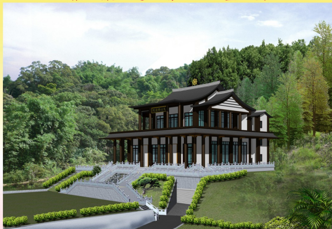
天心佛道院建廟工程集錦