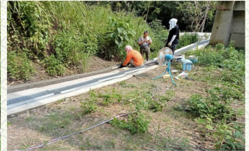
環山水溝蓋鍍鋅頂板