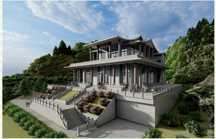
建廟工程集錦-水保工程