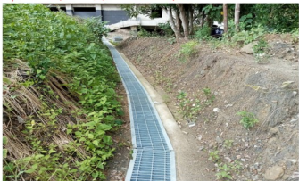
環山水溝蓋鍍鋅頂板