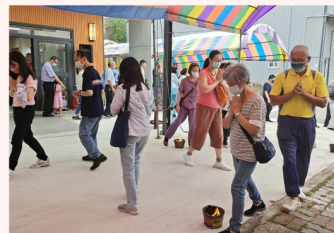
過七星火祛煞之景