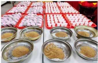
法藥、法水、煙供粉之景