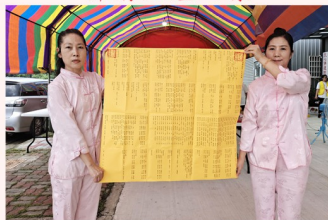
恭焚功德主名單之景