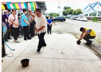
關聖恩師開教七星火