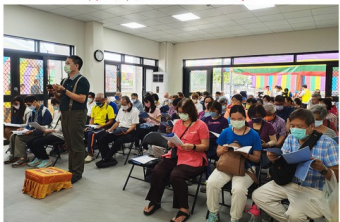
大眾虔誠誦經之景