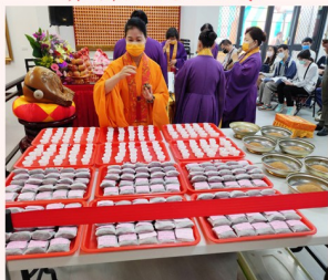
加持法藥、法水之景