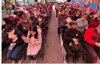
善信水供養暨誦經之景