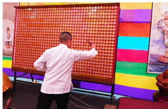
阿彌陀佛開燈暨加持甘露水之景