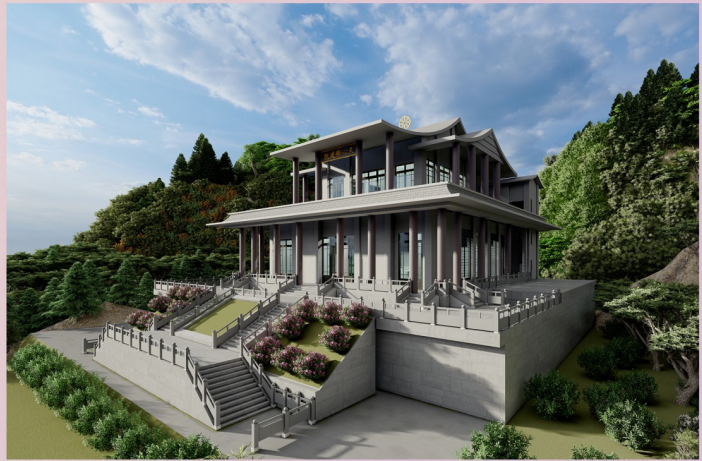
建廟工程集錦 - 護坡工程