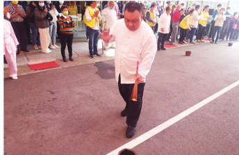
關聖開教七星火暨善信過火之景