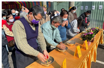
善信薰沐煙供淨化之景