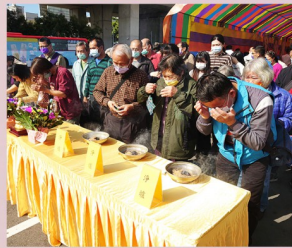
善信沐受煙供除穢