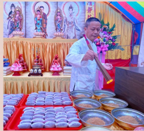
阿彌陀佛開燈暨加持煙供香粉之景