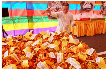
準提菩薩暨濟佛轉蓮花、加持結緣品