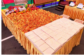
代祖先、冤親供養之白米、蓮花