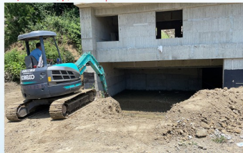
水保工程-施做排水設施