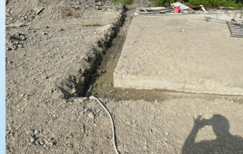
水保工程-施做排水設施