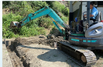
水保工程-施做排水設施