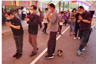
善信過七星火祛煞