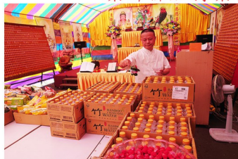
觀世音菩薩加持大悲水