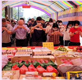
代今世父母點燈之景