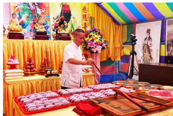
藥師佛加持藥供包、淨水之景