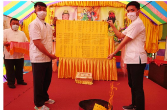
恭焚法會功德主名單