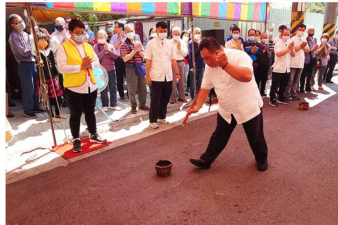
關聖帝君開敕七星火