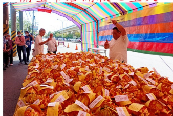
地藏菩薩、濟佛轉蓮花