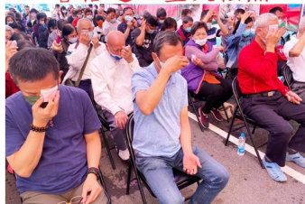
藥供包吸收病氣之景