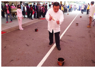
關聖加持七星火之景