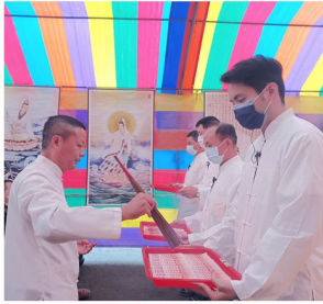
天官大帝加持開運金暨加持甘露水之景