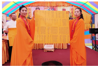
恭焚功德主名單之景