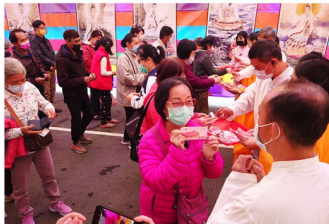
發送開運金法喜之景