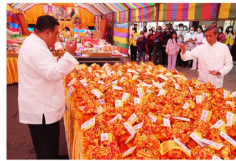
眾恩師教化紙人過運之景