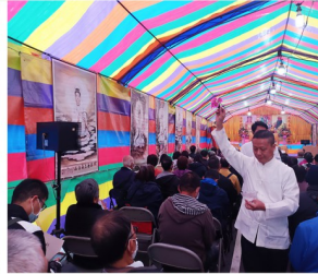
為參加之善眾加持之景