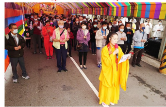
恭誦放生神咒之景