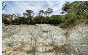
邊坡噴漿作業完成