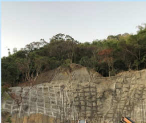
邊坡噴漿作業完成