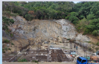
邊坡噴漿作業開始