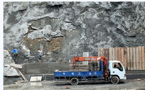
擋土牆上半部模板組立