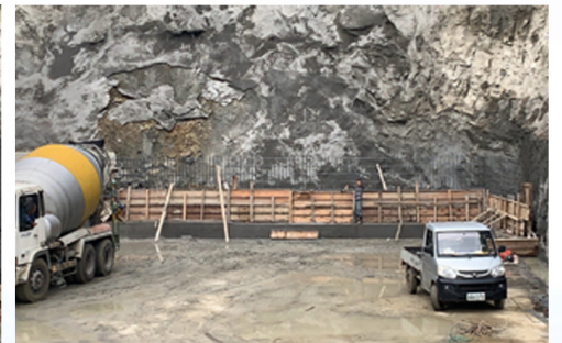
擋土牆下半部灌漿