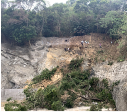
上方邊坡掛網作業