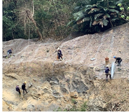
上方邊坡掛網作業