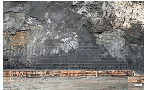
擋土牆基礎灌漿完成