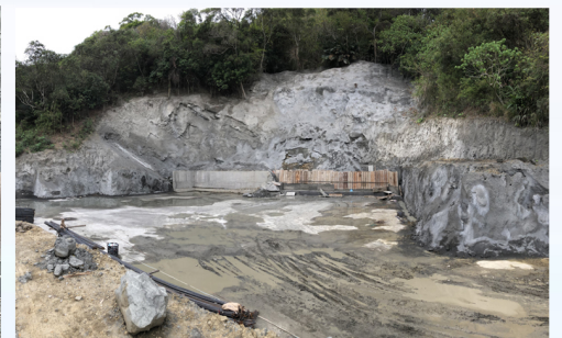
擋土牆上半部模板完成組立