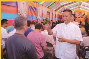
為善信遍灑法水祛厄之景