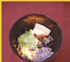
恭焚『善信佳作共賞集』