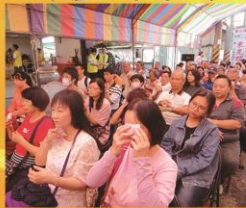
藥供包祛病煞之景