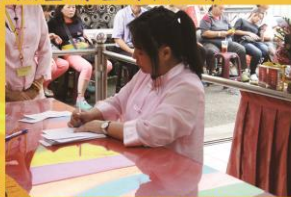
九天恩師批蓮花單之景