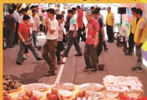
善信過七星火祛厄之景