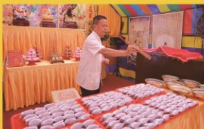
藥師佛加持藥供包祛煞暨開燈賜福之景