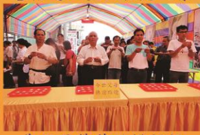
為父母佛前點燈祈福