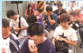
藥供儀式佛恩加披護祐之景