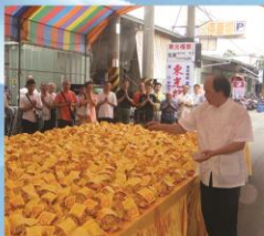
轉蓮花祛厄佛光加披