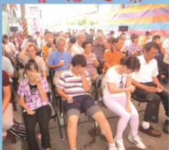
藥供祛病厄佛光加披