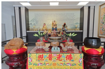
一樓莊嚴主殿之景