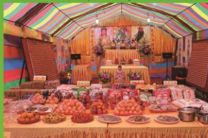
百味佳饌普施眾生