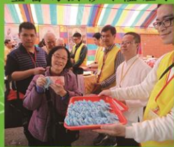
福氣『袋』著走喔! 『天官』賜我財喔!