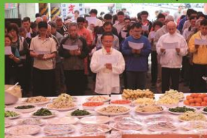
百味珍饈上供十方三寶