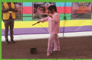
九天恩師加持七星火