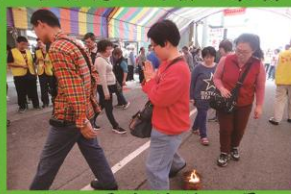
過七星火祛煞之景