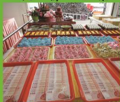
豐富的摸彩好禮喔!