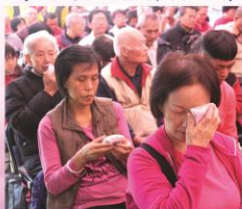
藥供包除病厄之景