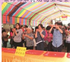
為父母點燈祈福之景