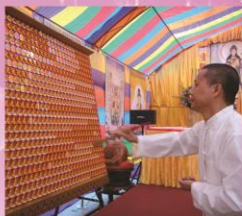
藥師佛加持功德主之景