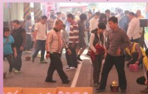
過七星火除煞之景