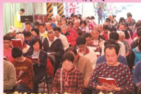
善眾虔誦經典之景